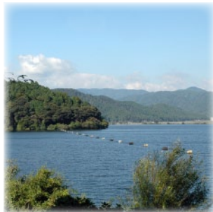
へらぶな専用釣り場