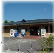
組合事務所（休憩所併設）