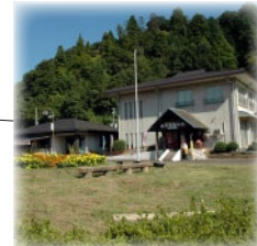
「はごろも市」にて特産品販売。

家族連れもゆったり安心のワカサギ釣り場。 入場定員約 600 名・駐車場 200 台。