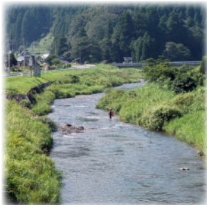
安定した釣果で人気のポイント。