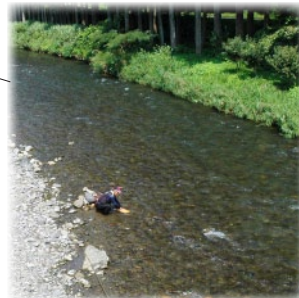
川幅広く河岸まで車で侵入できる。